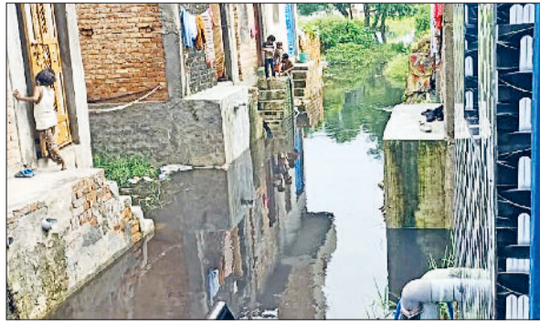
बहादुरगढ़। छोटूराम नगर की गलियों में भरा पानी से आया पानी।