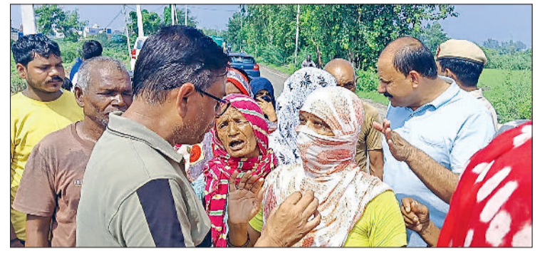
झज्जर। जलभराव से परेशान महिलाएं वार्ड पार्षद प्रतिनिधि से उलझते हुए।

जलभराव से परेशान वार्ड नंबर दो के लोग सड़कों पर उतरे, जताया विरोध